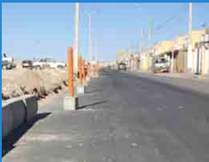
Estas imágenes representan el antes y el después de los trabajos de pavimentación del perímetro de la villa Tucnar Huasi. El proyecto avanza conforme a lo proyectado por DMH.