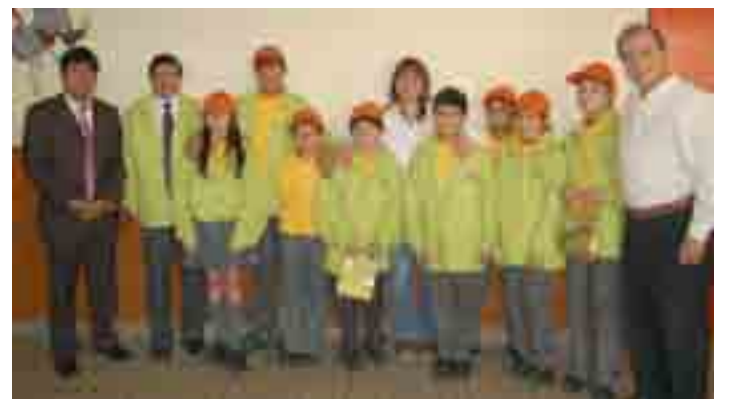
Este es el equipo que compone la radio comunitaria de la Escuela Valentín Letelier. Los menores desarrollan sus habilidades comunicativas y de personalidad, a través de esta verdadera herramienta educativa.