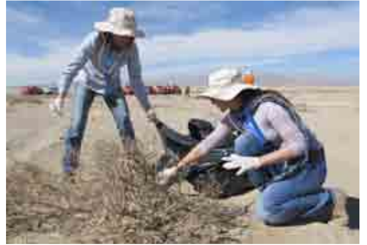
Trabajadores propios y colaboradores participaron en operativo de limpieza.

Trabajadores de todas las áreas participaron en la primera campaña de aseo que impulsa la División