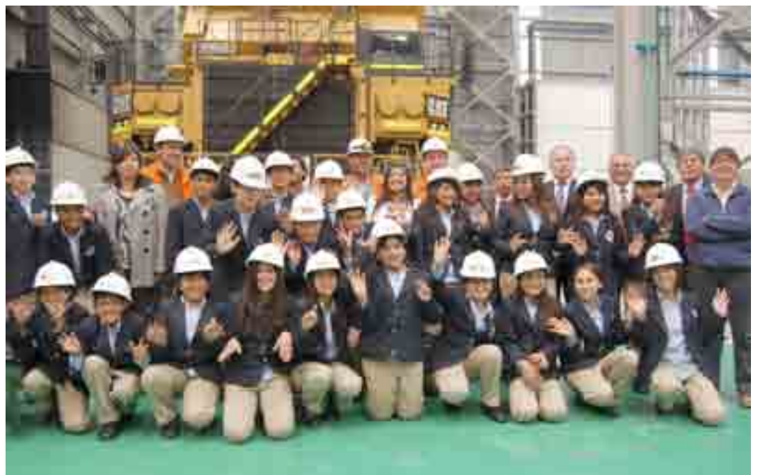
Los alumnos quedaron maravillados por las instalaciones del taller de camiones de la División, además de los premios recibidos.