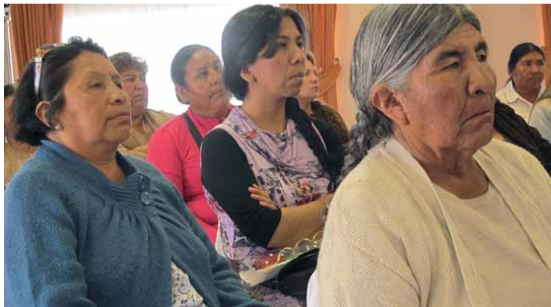
Las mujeres celebraron el Día Internacional de la Mujer Indígena.