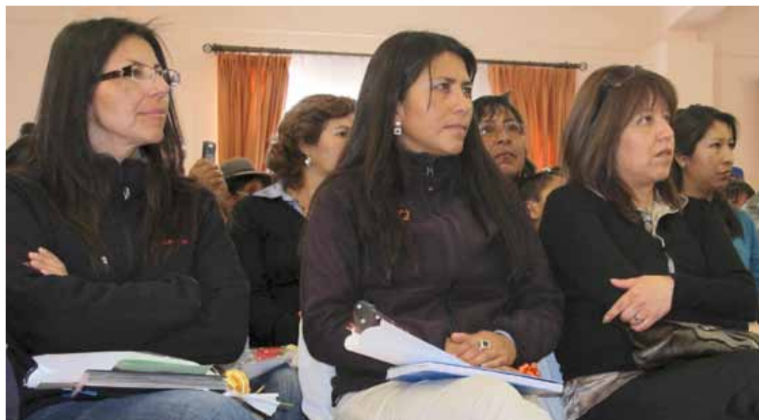
Representantes de la División Ministro Hales participaron en la actividad.