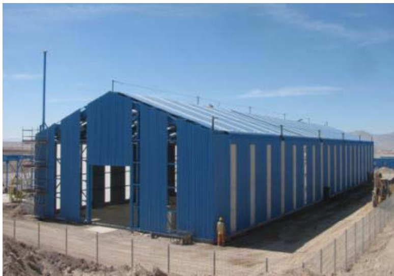
Obras Tempranas MH

• Con estos proyectos se entregaron a operación activos por MUS$ 405