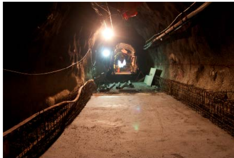
Túnel Desvío Río Blanco