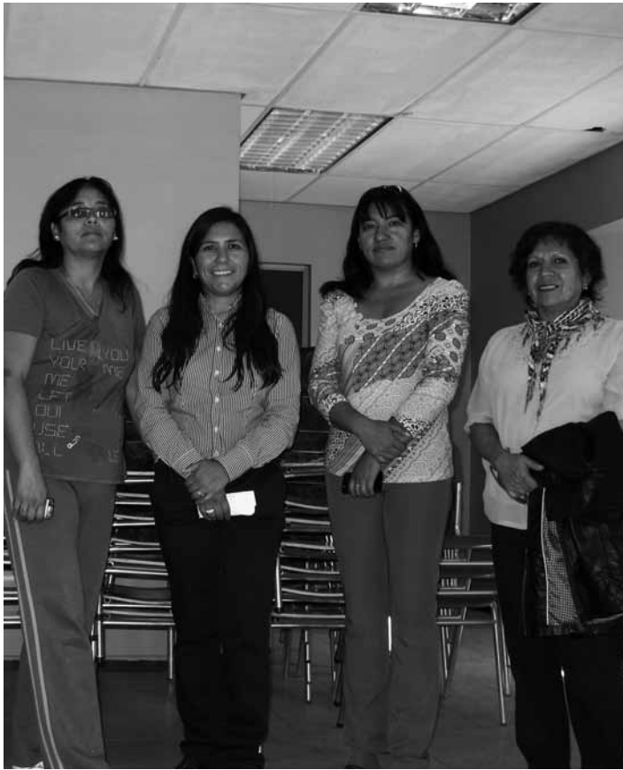
Los vecinos de la Junta Nueva Esperanza recibieron su implementación.