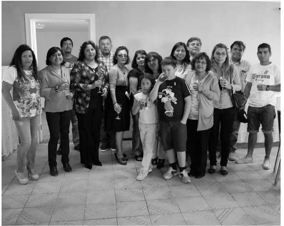
Toda la familia San Lorenzo se reunió gracias a la entrega del FIS.