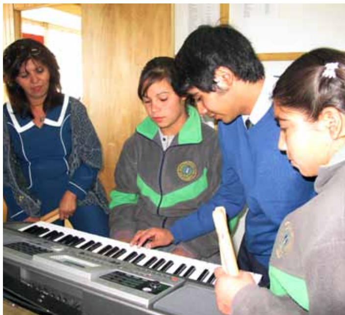
Las clases de lenguaje, matemáticas y ciencias, serán más entretenidas para estos alumnos gracias a los nuevos instrumentos.

Mayor Aguas Vivas, quieren más, es por esto que ya tienen pensado y se van a poner a trabajar para postular a los fondos del 2014, ya que también quieren ampliar su sede donde ensayan diariamente el conjunto folclórico para las diversas presentaciones que tienen agendadas, lo quieren, ya saben cómo hacerlo y no se detendrán hasta conseguir todos sus sueños.