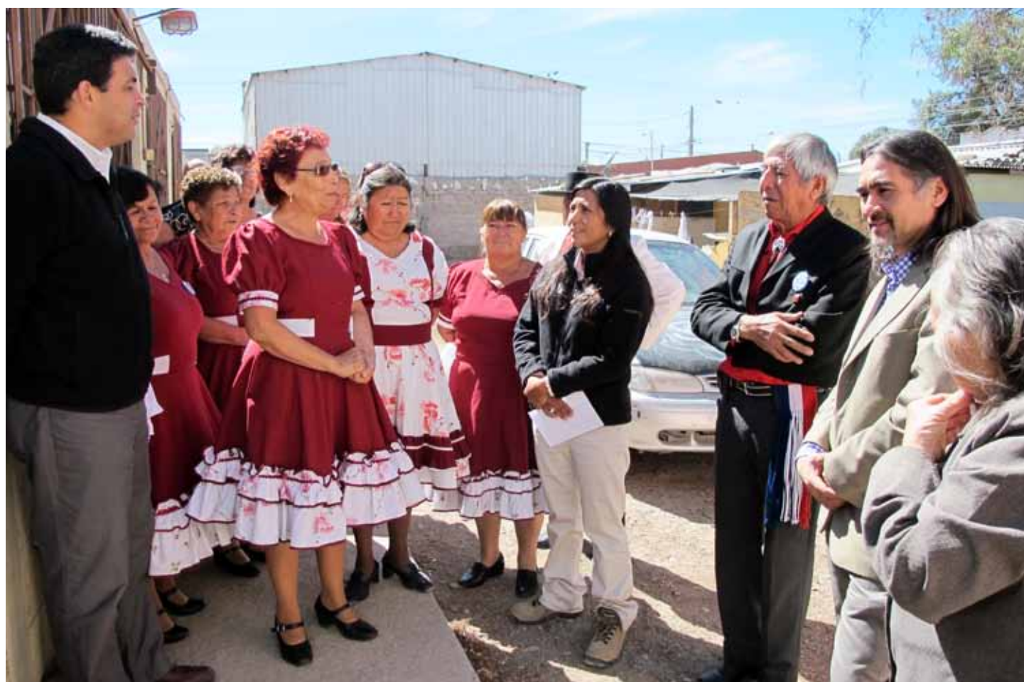
Diferentes agrupaciones de Calama fueron beneficiadas con la entrega de recursos provenientes del Fondo de Inversión Social de División Ministro Hales.