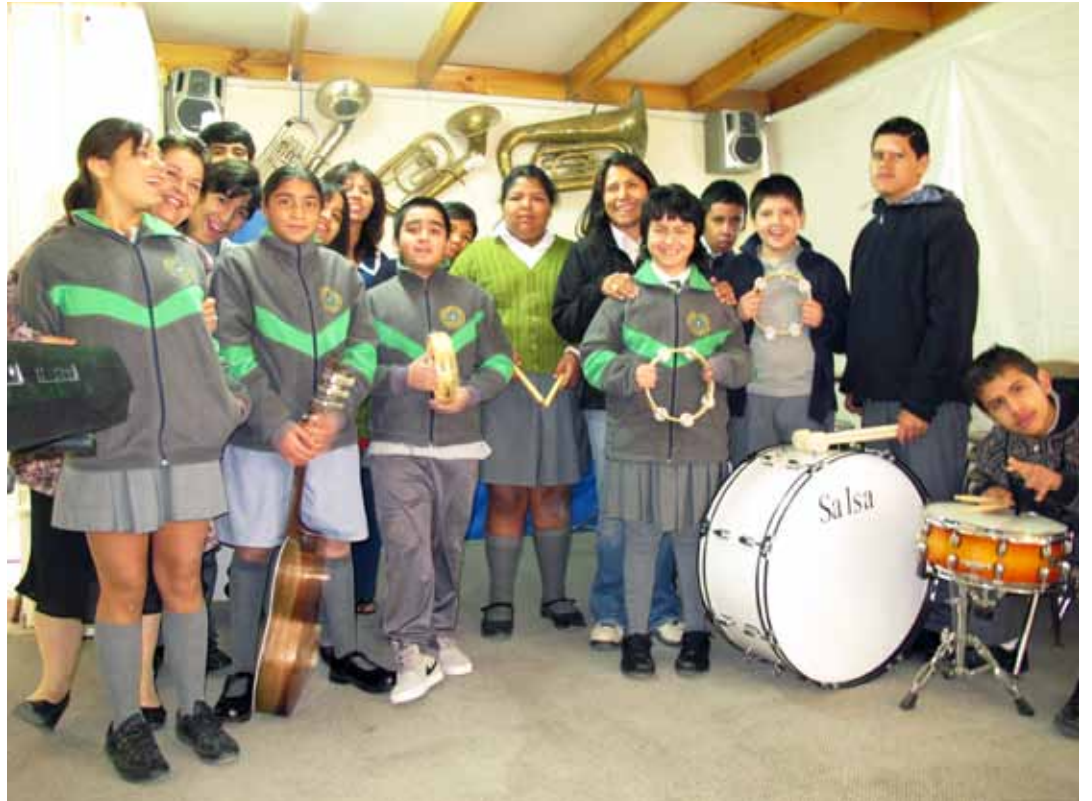
Los más de 180 instrumentos nuevos que llegaron a la Escuela gracias al FIS contribuirán a fomentar el método musical de enseñanza.

El compromiso de la Escuela, de División Ministro Hales y de la Municipalidad de Calama, permite que hoy los alumnos de la Escuela Especial Santa Cecilia puedan contar con 31 instrumentos melódicos como trompetas, teclados y guitarras; 114 de percusión tales como tambores, bombos, claves y triángulos y 36 accesorios entre los que se destacan terciados, baquetas y atriles.