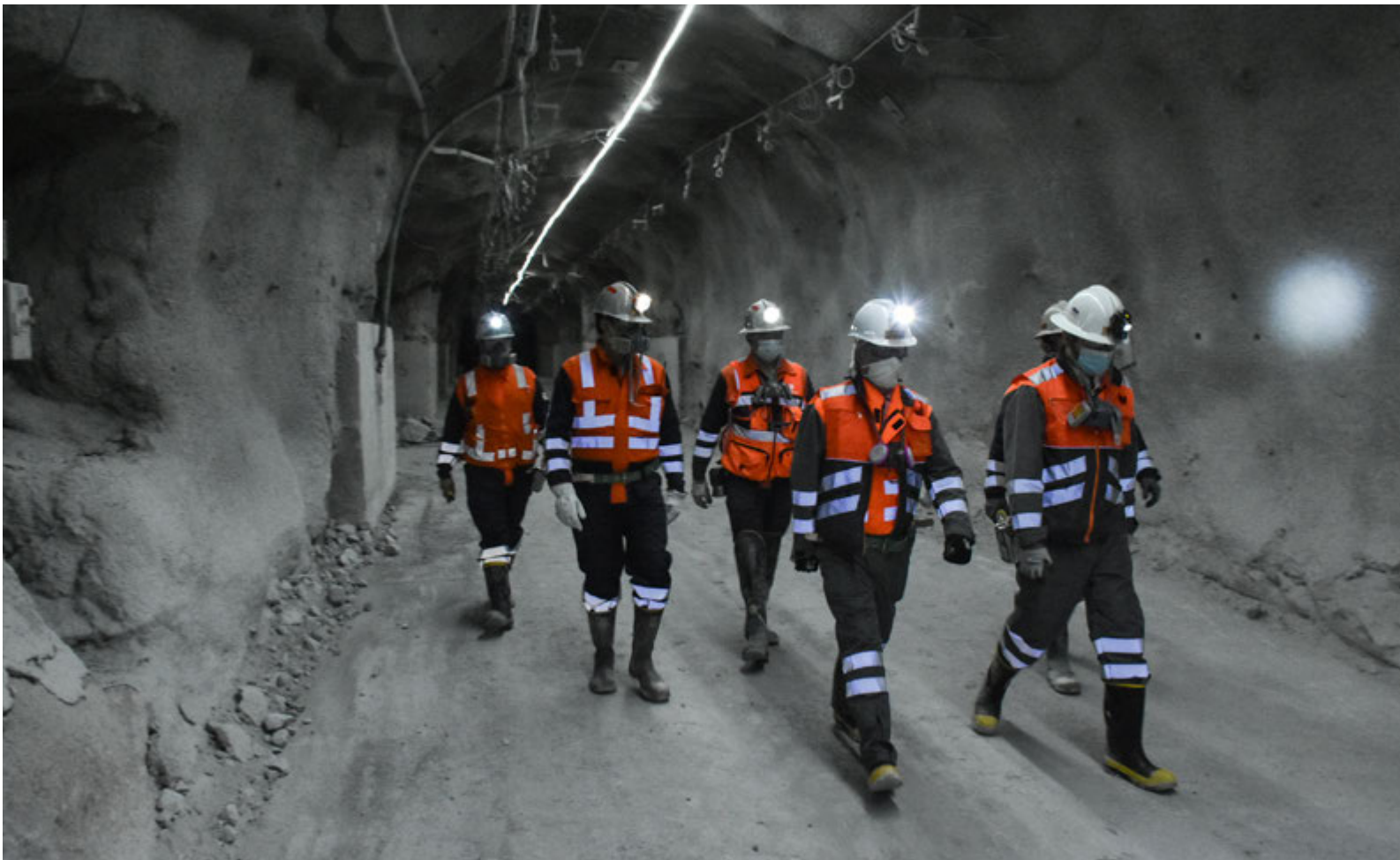
El equipo directivo divisional realiza una inspección en Chuquicamata Subterránea. El desarrollo de éste y otros proyectos estructurales es analizado de forma permanente por el directorio.