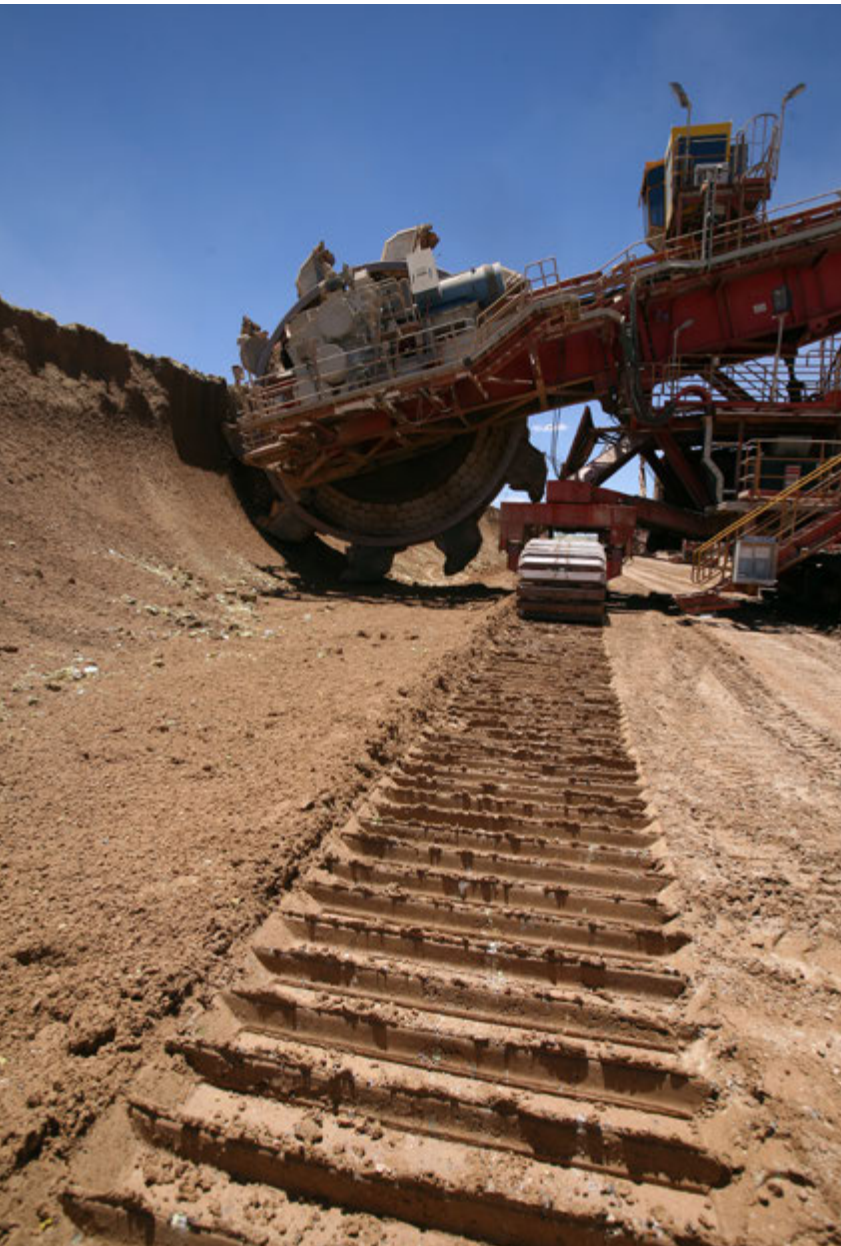
Gabriela Mistral, instalaciones y operaciones.

Analizó en profundidad los procedimientos de licitaciones, compras, contratos y las modificaciones de contratos presentadas por las gerencias de Abastecimiento corporativo y de la Vicepresidencia de Proyectos, de acuerdo al Manual de Alcance de Facultades de la Corporación, recomendando su aprobación al directorio.